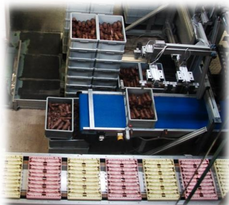
A csoki formázása

Szeptember 30-án az 5–8. osztályos tanulók autóbuszal Ausztriába kirándultak. Először felgyalogoltunk a hainburgi várhoz. Ezután a Kitsee-i csokigyárat látogattuk meg. Itt bemutattak egy kisfilmet, ami a csoki készítéséről szólt. Láttuk, ahogy a formát töltik, majd a csokiformát csomagolják. Mindenki örömmel kóstolgatta a kiválasztott édességet. Nagyon sokfélétt ettünk addig, amíg körbe jártuk a boltot. Végül diákok és tanárok vásárolhattak a nekik legjobban ízlő finomságokból. Vidáman indultunk haza a nap végén.