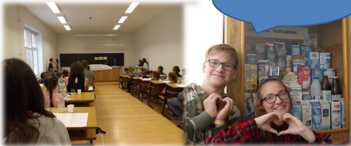
Az Élelmiszertudományi Kar termében.